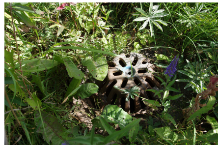
I centrum av växtbädden finns en bräddbrunn.