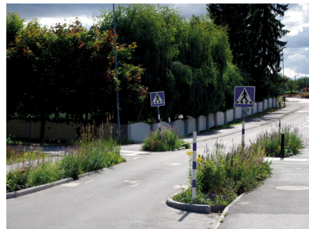
Växtbäddar i gatumiljö.