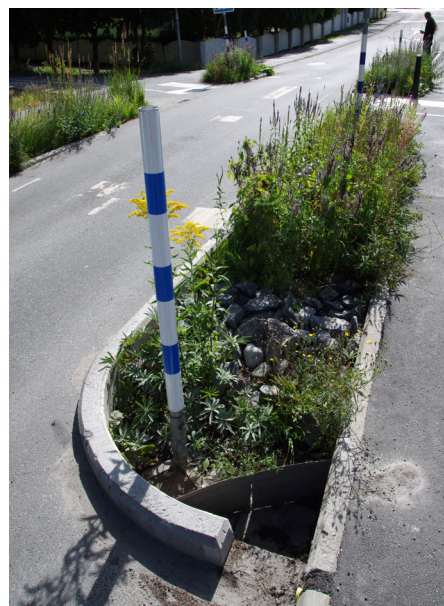
Vattnet leds in i bädden via en öppning i kantstenen.