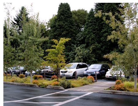
Denna växtbädd tar hand om takdagvatten som leds dit via husets stuprör.