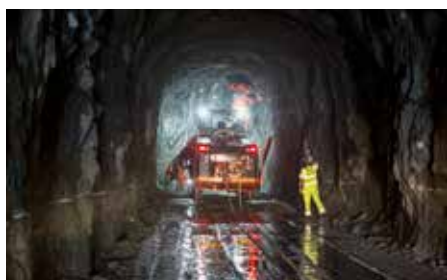
Inför varje sprängning borras ca 130 hål i berget. De fem meter djupa borrhålen fylls sedan med sprängämnen. Borrigen på bilden jobbar just nu ca 70 meter under marken nära Enskedehallen.

Det är ovanligt att skador inträffar på grund av sprängningar. Om det ändå skulle uppstå en skada som du misstänker beror på våra arbeten kan du anmäla det till oss,