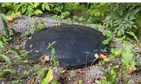
Locket på LTA-anläggning

Anläggningen känns igen på locket som måste vara helt ovan mark för att förhindra att grus och annat tar sig ner i tanken. Resterande delar ligger under marken.